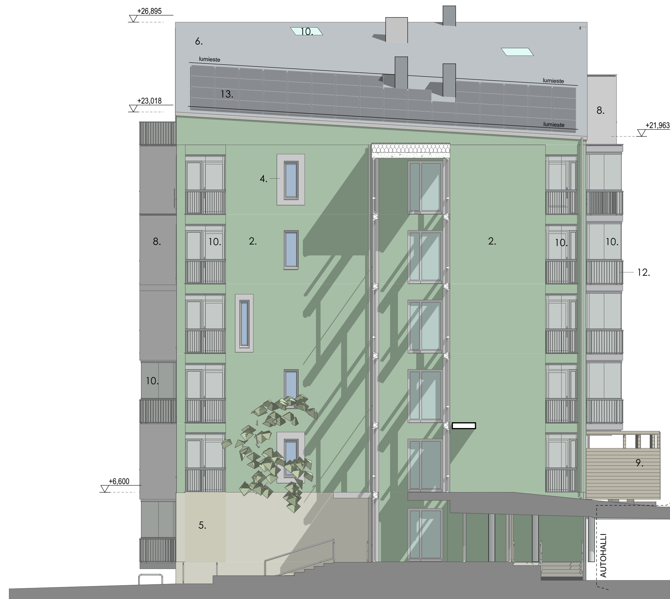
RAK. B, PÄÄTY LOUNAASEEN